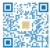
(扫描二维码查看活动详情)

“家藏老书·传承文脉”微视频征集活动家中的老书，藏着跨越时光的家族故事；泛黄的纸页，承载着生生不息的中华文脉；墨香的卷册，更能与AI碰撞出传承新火花！翻开家藏老书，以镜头定格经典，以科技赋能传承，每一页都是一场传统与现代交融的文化之旅！