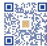
(扫描二维码查看活动详情)