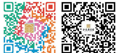
阅美·书馨 金陵微信