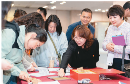
(文/特藏发展部 张恺)

此次系列活动以联展为核心，集展览、培训、研讨、体验于一体，是南京都市圈公共文化协同发展的生动实践。活动不仅扎实做好古籍文献的保护与传承工作，守住地方文化根脉，还通过新颖多元的创新形式，让古籍走出馆藏、贴近群众、融入日常。同时有效整合本地优质文化资源，助力地域文化建设，持续传承弘扬中华优秀传统文化。未来，南京都市圈各图书馆将持续深化合作，提供更优质的公共文化服务，助力文化强市建设，让古韵文脉持续焕发新生。