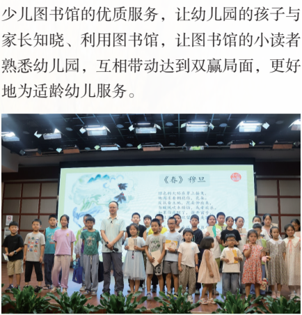
（辑/事业研究部 曹宁欣 吴梦菲）

项目开展以来，通过在幼儿园开展阅读教学专题讲座、定期教研、覆盖式轮流教学等，使得幼儿园每位老师都具备了独立开展阅读活动的能 力，培养了一批阅读推广人。与此同时，少儿图书馆通过与幼儿园合作，便于创新实践和新增服务，将静态的绘本变成一节节鲜活、有趣的阅读活动课程，激发幼儿阅读兴趣，帮助家长树立科学的亲子阅读理念，既利用了幼儿园的师资优势，又充分发挥了图书馆场地资源、图书资源和平台资源优势，让幼儿真正享受到了